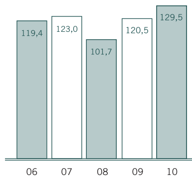
Total de l'actif géré Aux 31 décembre (en G$)